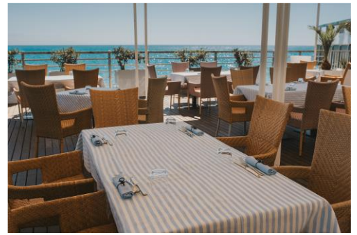
Cocktail bar PlanB